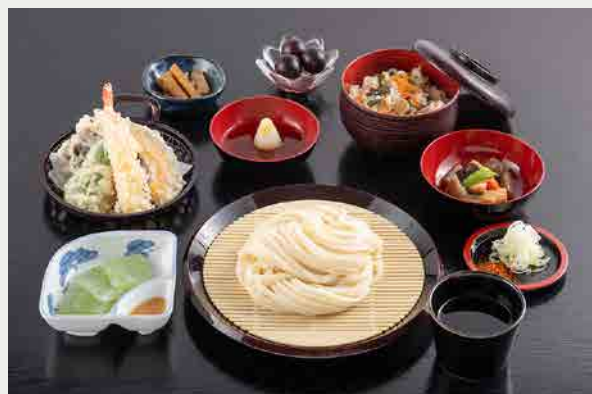
水沢うどん御膳 1,870円 (税込)