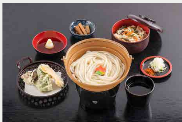
水沢釜あげうどん御膳 1,320円 (税込)