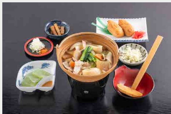
水沢おっきりこみ御膳 1,650円 (税込)