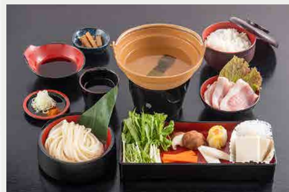
上州豚温しゃぶ御膳 1,650円 (税込)