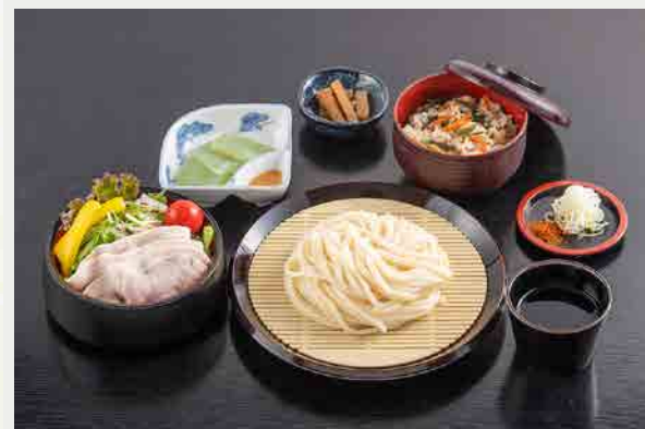
上州豚冷しゃぶ御膳(夏季のみ) 1,650円 (税込)

澄んだ空気、清らかな水、広大な大地。 群馬の大自然が育んだ豚肉は、 風味豊かでとことん美味しい。