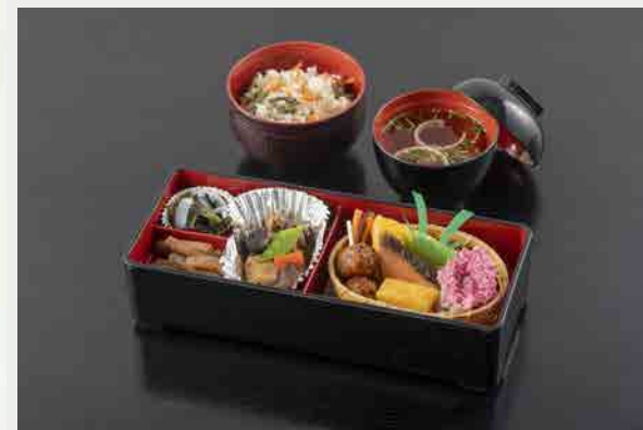
伊香保御膳 1,320円 (税込)