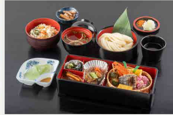
伊香保御膳 1,870円 (税込)