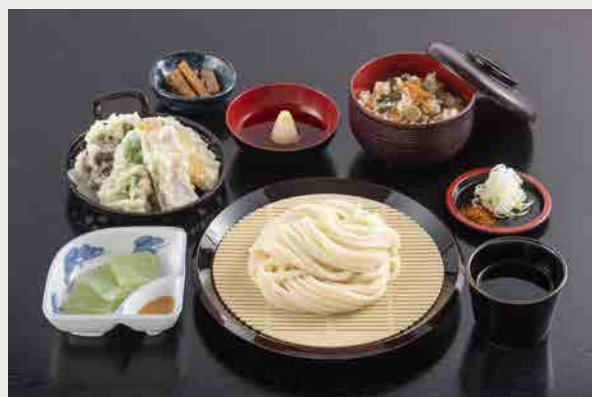
水沢うどん御膳(天ぷら4品) 1,650円 (税込)