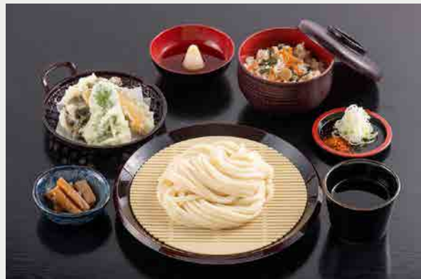
水沢うどん御膳(天ぷら3品) 1,320円 (税込)

自然豊かな上州の大地が育んだ旬の素材を吟味し、真心込めたお料理を心ゆくまでごゆっくりとお楽しみください。