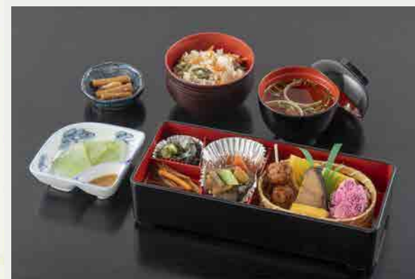
伊香保御膳 1,650円 (税込)